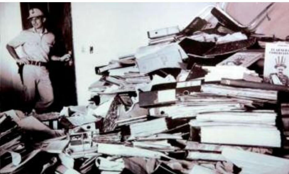
Una foto histórica del hallazgo de los archivos de la Policía, ocultos en una dependencia en Lambaré. 1992.

"El Archivo descubierto el 22 de diciembre de 1992, permitió a su vez, conocer al día siguiente los archivos de "LA TÉCNICA" y en las semanas siguientes de 1993 y en el marco de procedimientos judiciales los de la Comisaría Tercera, Departamento Judicial de la Policía, Policía de Coronel Oviedo. Caaguazú y el del Estado Mayor General de las Fuerzas Armadas (ESMAGENFA). En 1994, Archivo del Asilo de Ancianos. Capiatá, En 2002, los Archivos de las Comisaría Sexta, Tercera y Undécima de la Capital. Asunción. El Archivo del Ministerio del Interior y de la Agrupación Logística de la Tercera División de Caballería en Asunción, en 2008. Un año más tarde, el del Ministerio de Defensa Nacional. Asunción. Finalmente en febrero del 2012, el de Armada Nacional, tras años de gestiones en los Tribunales en la causa habeas data de Martín Almada."