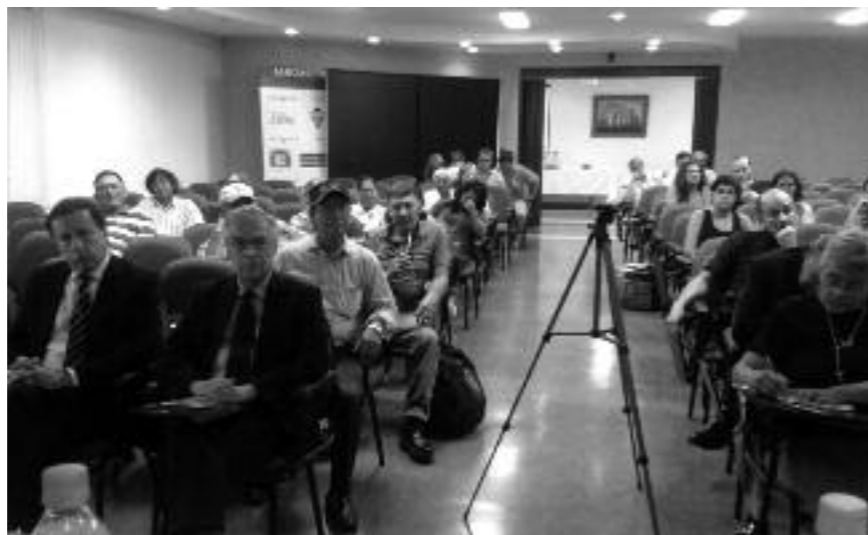
Diplomáticos, referentes de víctimas de la dictadura y de DD.HH. en la apertura. Aula Magna UCA. Nov. 2012.