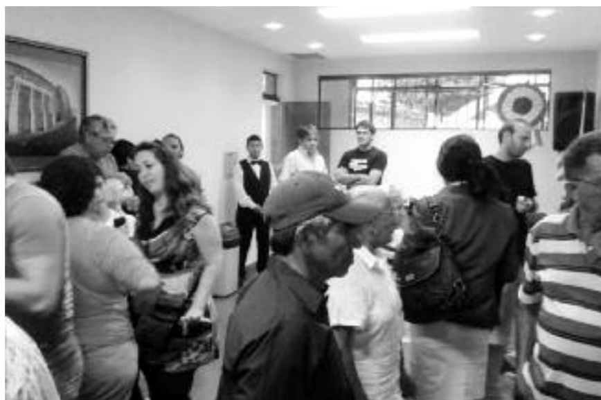
Vista parcial de la apertura del seminario. Nov. 2012. Aula Magna UCA.