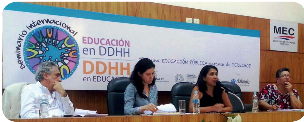
Victoria durante el seminario en el que se analizaron los desafíos para la implementación del Plan Nacional de Educación en Derechos Humanos (PLANEDH) en Paraguay.