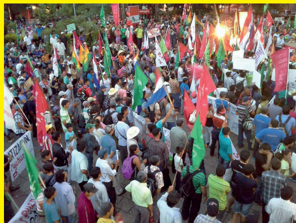
Marcha por el día internacional de los DDHH.

Por su parte, puede asumirse una duda razonable acerca de las posibilidades de que el Paraguay sea “ambiental y económicamente sostenible” con la impresionante cantidad de agrotóxicos derramados cada año sobre el territorio (sólo entre los años 2009-2010 se utilizaron más de 8 millones de litros de gli-