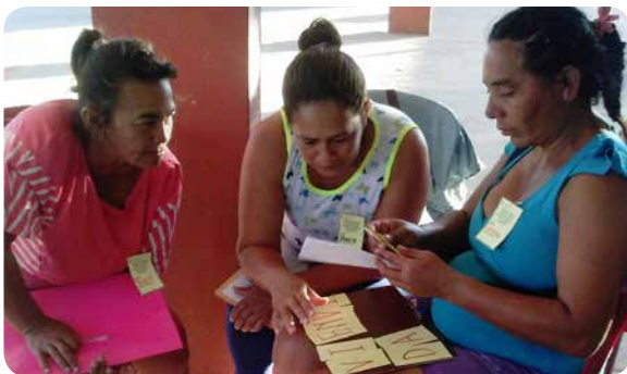
Reunión entre el comité ejecutivo de la CODECO y una de sus asociaciones miembros: la Comisión Vecinal San Miguel Guerrero.