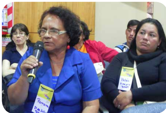
Docentes de diferentes localidades del país aportaron al debate.

Presentaron un resumen sobre las experiencias de los proyectos que abordan como objetivo central la temática de los derechos sexuales y reproductivos de niños/as y adolescentes. Los resultados muestran que existen coincidencias en cuanto a que los padres, madres y docentes, consideran importante el debate y la formación e información sobre conceptos y metodología para el abordaje educativo de la sexualidad con niños/as y adolescentes. Así mismo, los jóvenes coinciden en sus demandas y exigencias para que se imparta educación integral de la sexualidad en los diferentes ámbitos y niveles de la educación formal y no formal.