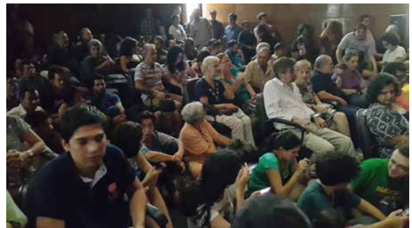
El lanzamiento del documental realizó en el Centro Cultural Juan de Salazar, con un lleno total de público.