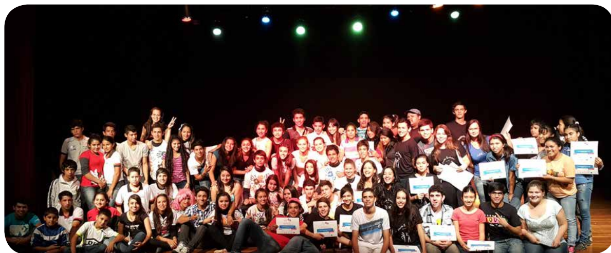
Los y las integrantes de todos los elencos que participaron del Festival de Teatro Guasu del Proyecto Jaikuua.