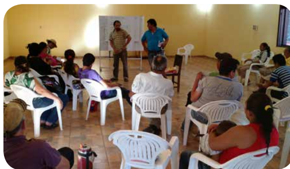
Facilitadores y participantes en el primer taller de formación realizado en Concepción.

En el desarrollo de estos encuentros se utilizan diferentes técnicas que permiten crear un ambiente pedagógico adecuado para el tratamiento de los temas; se busca en todo momento guiarse en base a los enunciados de la educación popular para generar participación, entusiasmo y dinamismo, valorando las experiencias y los saberes de los y las participantes para avanzar conjuntamente en las discusiones temáticas.