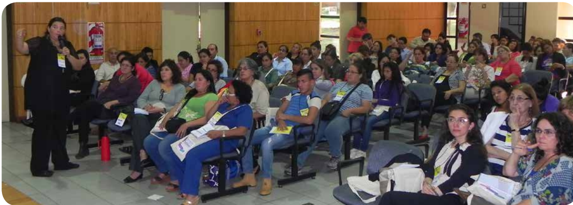
Expertas y expertos internacionales expusieron en los diferentes ejes desde las experiencias y aprendizajes en sus respectivos países.