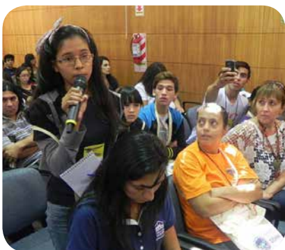
Estudiantes de instituciones educativas e integrantes de organizaciones juveniles expusieron sus puntos de vista.

En este sentido, expuso como desafíos importantes: la existencia de una voluntad política clara que se expresa en leyes, políticas, programas. Ejemplo: Argentina, Brasil, Cuba, Ecuador; el trabajo constante y coordinado de las ONGs para hacer conciencia en la población, superar prejuicios e incidir en las políticas públicas. Este trabajo de abogacía debe fundamentarse en evidencia científica proveniente de las Encuestas Nacionales de Salud Reproductiva y de investigaciones específicas; y, la incorporación de la Educación de la Sexualidad en la formación del personal docente.