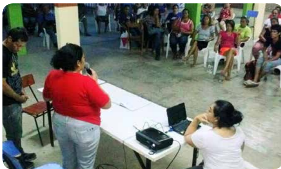
Asamblea General Ordinaria de la CODECO, en la Escuela Santa Cruz, el pasado 25 de marzo.