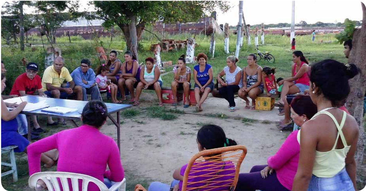
Primer taller del Proceso de Capacitación en DESCAs y Modelo Organizativo Democrático con referentes comunitarios de la CODECO, en la Escuelita Caacupemí.