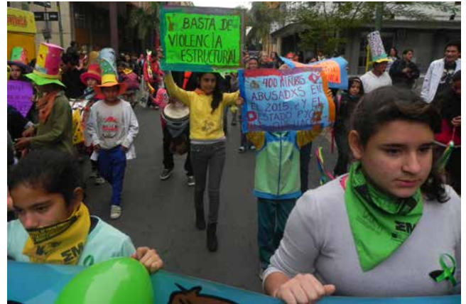
Marcha ciudadana contra la violencia sexual hacia niñas, niños y adolescentes.

Por su parte, tres investigaciones recientes describen un panorama más que crítico al respecto. Una de ellas es la Investigación sobre la caracterización de la explotación sexual de niños, niñas y adolescentes en Encarnación (2012) (Beca/Cectec/Secretaría de la Niñez y Adolescencia/Unión Europea). El estudio muestra cómo en la explotación sexual convergen una serie de carencias múltiples, materiales y afectivas que configuran el marco aprovechado por adultos en situación de poder para el ejercicio de la violencia sexual en niños, niñas y adolescentes.