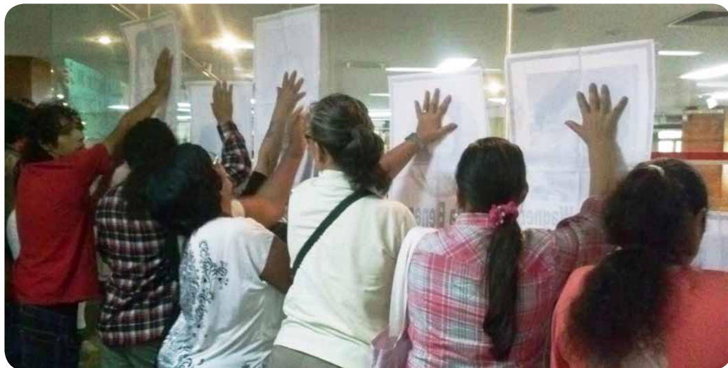
Presenciando la sesión de la Junta Municipal de Asunción, el 22 de abril pasado, oportunidad en que fue tratada la reducción de la cota del río Paraguay.

A estas alturas de una puja histórica por bienes debidos en base a sus derechos arrebatados, la población bañadense redobla su apuesta al fortalecimiento de sus organizaciones sociales de base, zonales y otras intermedias, así como a sus instancias de articulación en los diversos ámbitos donde interactúa reivindicando sus antiguos reclamos sobre el territorio al que han dado y les da vida. Esto, frente a los consabidos proyectos estatales que amenazan su permanencia tales como el de la Franja Costera y Avenida Costanera –por su segunda etapa-, como el de la Ley de Reserva Ecológica previstos arbitrariamente para esta zona ribereña.